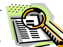
Активность и зна-