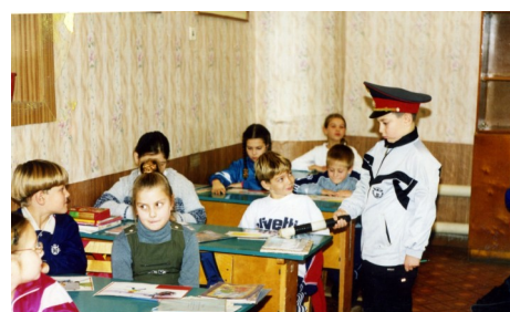
Соблюдай правила! (из истории деятельности отряда ЮИД)